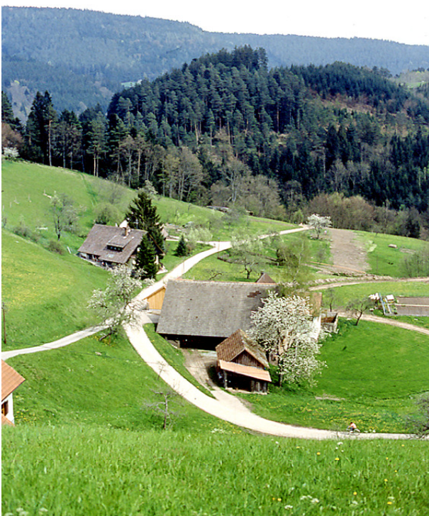
Hoferschließung im Schwarzwald