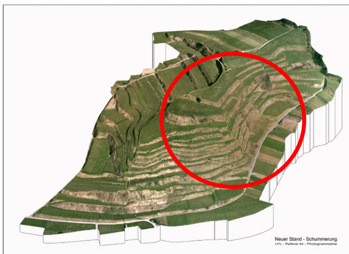
Alter Bestand - man sieht die Mißstände

Die Reblandschaft kann im Computer abgebildet werden: