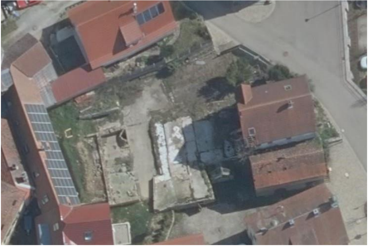
Die beiden Grundstücke von oben