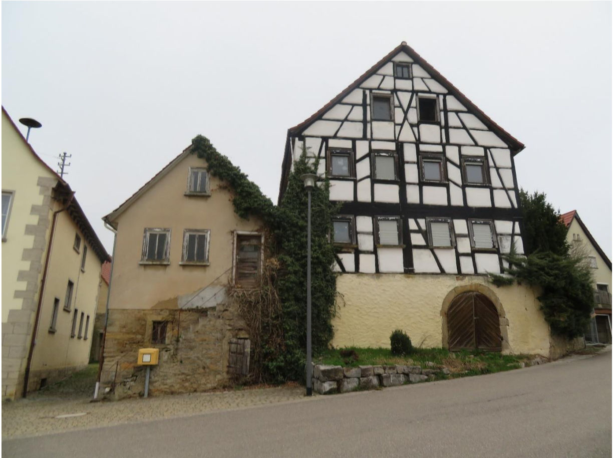
Bild der beiden Häuser von vorne (Links ist ehemals Grieser, rechts ist ehemals Franke)