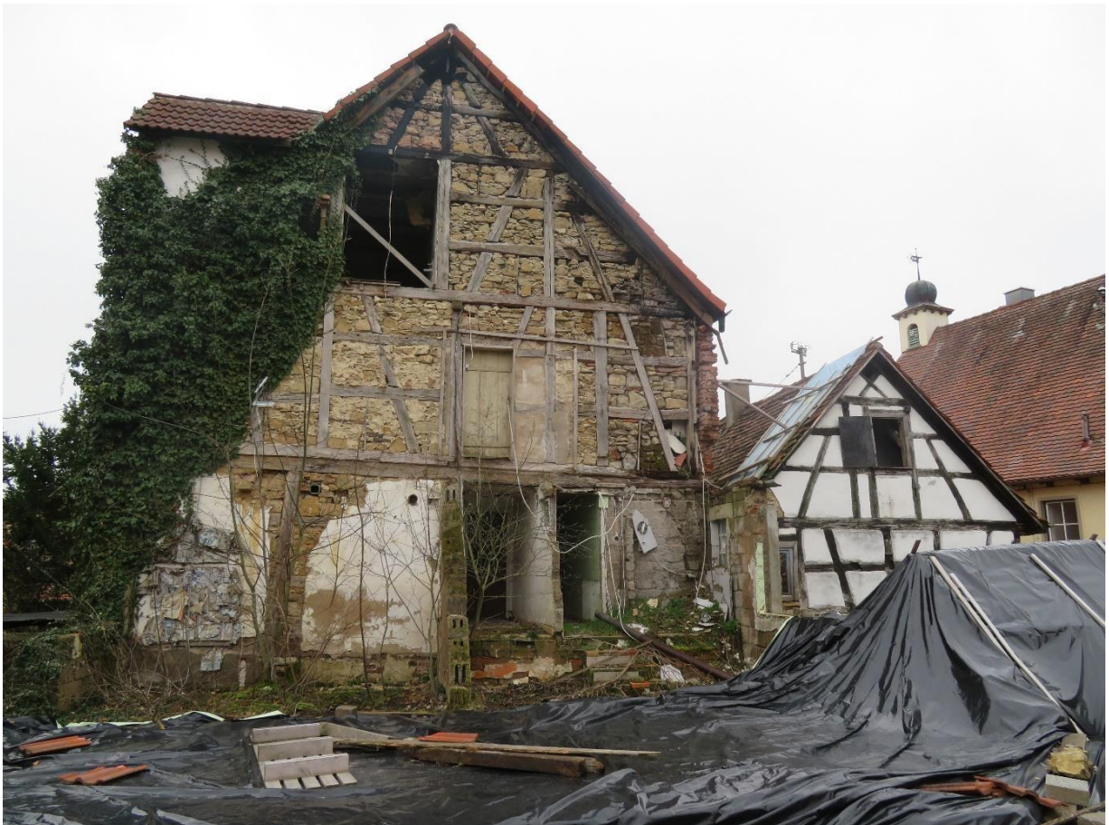
Bild von hinten (die damalige Scheune ist bis zum Wohnhaus Franke abgebrannt)