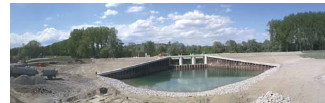
Ein- und Auslassbauwerk kurz vor Fertigstellung im September 2012

Für die betroffenen Anlieger nördlich von Iffezheim soll schnellstmöglich der ursprüngliche Hochwasserschutz, wie er vor dem Oberrheinausbau bestand, wieder hergestellt werden. Möglich ist dies jedoch nur, wenn alle Maßnahmen am Oberrhein verwirklicht werden. Neben Rückhaltmaßnahmen in Frankreich und Rheinland-Pfalz tragen insbesondere die 13 Hochwasserrückhalteräume des Integrierten Rheinprogramms zum Hochwasserschutz bei.