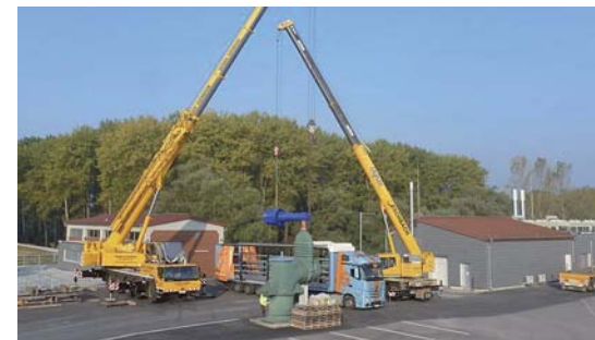
Einbau der neuen Pumpen am Schöpfwerk Philippsburg 2015

Tagesaktuell können drei Messstellen in Philippsburg, zwei in Oberhausen/Rheinhausen sowie der Innen- und Außenwasserspiegel des Altrheins am Schöpfwerk Philippsburg über die Homepage der Stadt Philippsburg abgerufen werden. Die Grundwasserstandsdaten der übrigen Messstellen werden jährlich ebenfalls auf der Homepage eingestellt. Die Grundwasserstände finden Sie auf der Internetseite der Stadt Philippsburg, dort unter Rathaus/Services A-Z/Grundwasserstände.