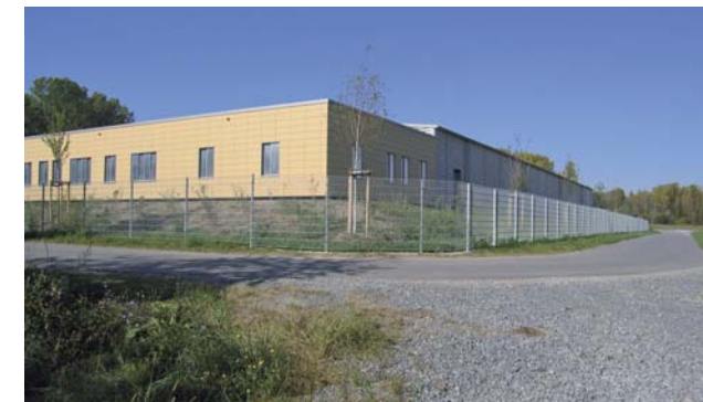
Betriebszentrale am Schöpfwerk Philippsburg

Der Polder Rheinschanzinsel kann nun künftig ebenfalls eingesetzt werden. Die Rückhalteräume Weil-Breisach, Kulturwehr Breisach und Elzmündung sind im Bau, die übrigen sind in der Planung.