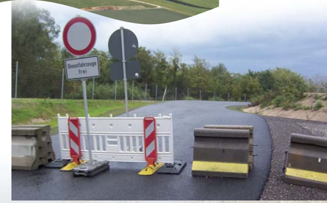
Straßensperren bei Hochwassereinsatz des Polders

Um der Bevölkerung die Gelegenheit zu geben, sich vor Ort über die Themen Hochwasserschutz sowie Flora und Fauna im Auenwald zu informieren, wird im Bereich der Mittelhöfe ein Polderinfopfad errichtet.