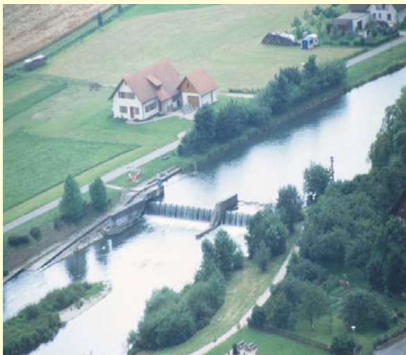
Luftbild vor dem Umbau

Maßnahme: Am vorgesehenen Standort gab es in der Vergangenheit bereits Anlagen zur Wasserkraftnutzung. Der Standort wird neu aufgegriffen für den Bau eines Kraftwerkes mit einer Rohrturbine mit ca. 200 kW Leistung. Damit lassen sich beispielsweise ca. 300 Haushalte mit Strom versorgen. Auf fischerliche Belange und Freizeitbelange wird Rücksicht genommen und ein Fischpass sowie eine Bootsgasse angeordnet.