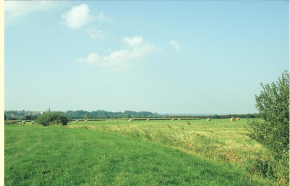
NSG Ölkofer Ried

Gemarkung: Hohentengen, Ölkofer, Herbertingen Fläche: 382,6 ha Höhe: 550 m über NN Naturraum: Donau-Alblach- Platten Top. Karte: 7922