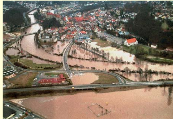
Bild Hochwasser 1990