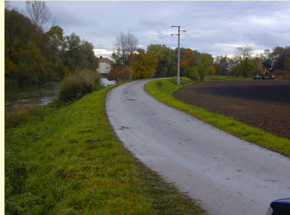
Zustand vor der Dammerhöhung

Schutz vor dem 200-jährlichen Donauhochwasser