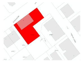
Abbildung 2 Richtig