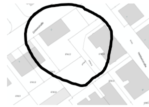
Abbildung 4 Falsch

Für Ihre Unterstützung bedanken wir uns vorab!