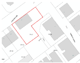
Abbildung 1 Richtig

Sofern möglich und sinnvoll, sollte sich die Markierung an den Grundstücks- oder Straßengrenzen orientieren. Sollten Sie lediglich einen Anbau beantragen wollen, reicht es aus die zu bebauende Fläche rot zu umranden. Verwenden Sie bitte keine unklaren Markierungen für Ihr Untersuchungsgebiet wie in Abbildung 3+4 dargestellt. Sobald keine eindeutige Lokalisierung Ihres Untersuchungsgebietes erfolgen kann, müssen Unterlagen nachgefordert werden und die Luftbildauswertung verzögert sich.