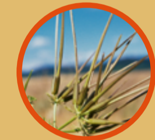
Venuskamm Der stark gefährdete Venuskamm fand früher als Würzkraut, ähnlich der Petersilie, Verwendung. Die ausgeprägten Früchte inspirierten zu dem klangvollen Namen.

Besonderheiten sind bereits im März zu entdecken. Hierzu gehört der kleinwüchsige Dreiblättrige Ehrenpreis mit seinen dunkelblauen Blüten und den dreilappigen, typischen Blättern. Nicht nur im zeitigen Frühjahr sind die Poltringer Projektäcker inmitten der ansonsten artenarmen Feldflur mit einem großen Blütenangebot eine echte Bereicherung. Zu den Kostbarkeiten dieses Projektgebiets zählen neben dem Sommer-Adonisröschen , der Hohldotter , der Acker-Rittersporn und das Dreibörnige Labkraut .