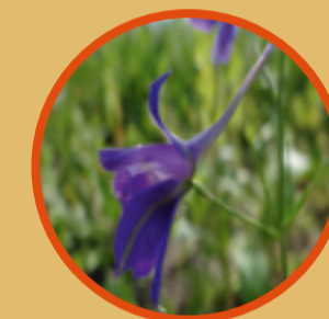
Acker-Rittersporn Der auffällige Acker-Rittersporn ist rückgängig, er kommt nur noch zerstreut an einigen Feldrändern vor. Auf einer Projektfläche in Lauterach begleitet er zahlreich das Wintergetreide.