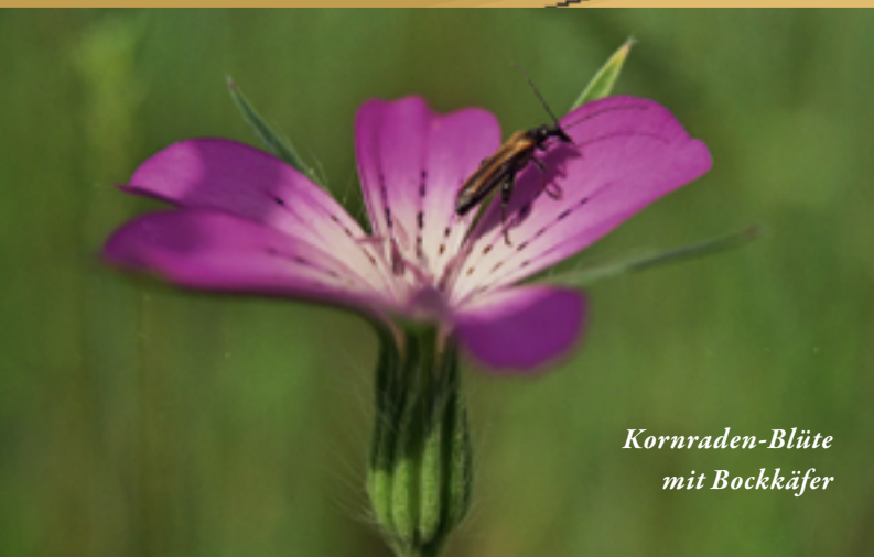
Kornraden-Blüte mit Bockkäfer