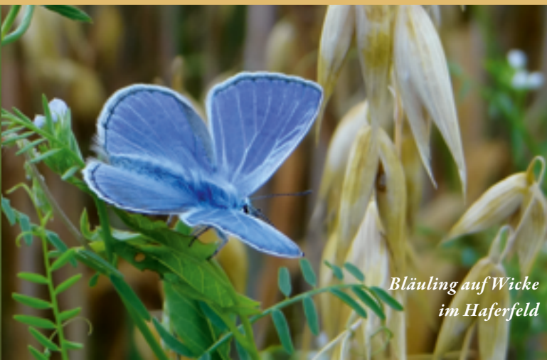
Bläuling auf Wicke im Haferfeld