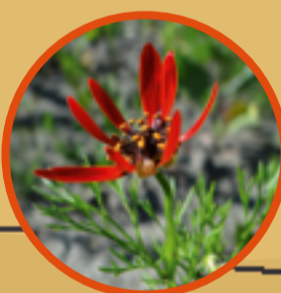
Flammendes Adonisröschen Zu den herausragenden Besonderheiten in Rangendingen zählt das vom Aussterben bedrohte Flammende Adonisröschen, es kommt nur auf wenigen Äckern vor.

Heute werden mit Unterstützung der Gemeinde Rangendingen in einer Art Museumslandwirtschaft auf über 14 Hektar Ackerwildkräuter erhalten und gefördert. Mehr als 20 Arten der Roten Liste wachsen wieder zahlreich und haben sich im Gebiet verbreitet. Die einstige kleinparzellerte Struktur mit dem Erdwegenetz wurde weitestgehend bewahrt. Dazwischen liegen magere, bunte Wiesen und Obstwiesen. Kleine dauerhafte Brachestreifen bereichern die Flur und bieten Lebensraum für eine mannigfaltige Insektenwelt. Acht ortsansässige Landwirte machen sich die Mühe, die Äcker nach den nötigen Vorgaben zu bearbeiten. Nicht immer kann eine Ernte eingefahren werden. Für Besucher gibt es über den Artenreichtum hinaus auch ehemalige bäuerliche Kultur mit alten Feldkulturen wie Emmer, Einkorn und Buchweizen zu bestaunen.