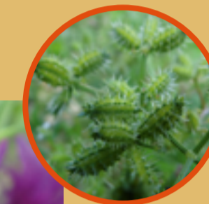
Möhren-Haftdolde An die Tierverbreitung angepasst ist die extrem selten gewordene Möhren-Haftdolde. Sie kennzeichnete die artenreichen Wildkrautgesellschaften auf Kalkböden.