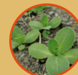
Orientalischer Ackerkohl Der stark gefährdete Orientalische Ackerkohl gehört zu den zahlreichen, mit Beginn des Ackerbaus bei uns eingeführten Arten, sog. Archäophyten, die im Getreidesaatgut einwanderten.