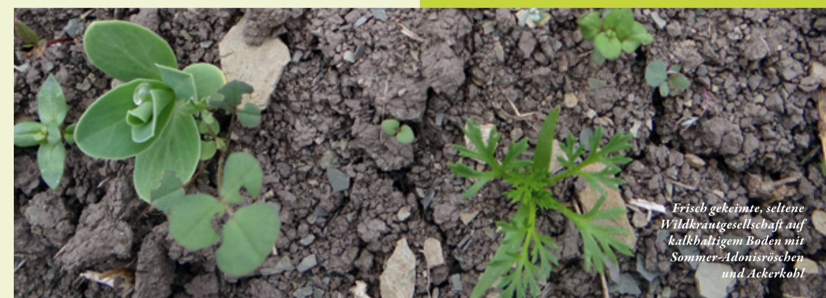
Frisch gekeimte, seltene Wildkräutergesellschaft auf kalkhaltigem Boden mit Sommer-Adonisröschen und Ackerkohl

Das Acker-Stiefmütterchen hilft bei Husten und Verschleimung sowie bei Hautproblemen.