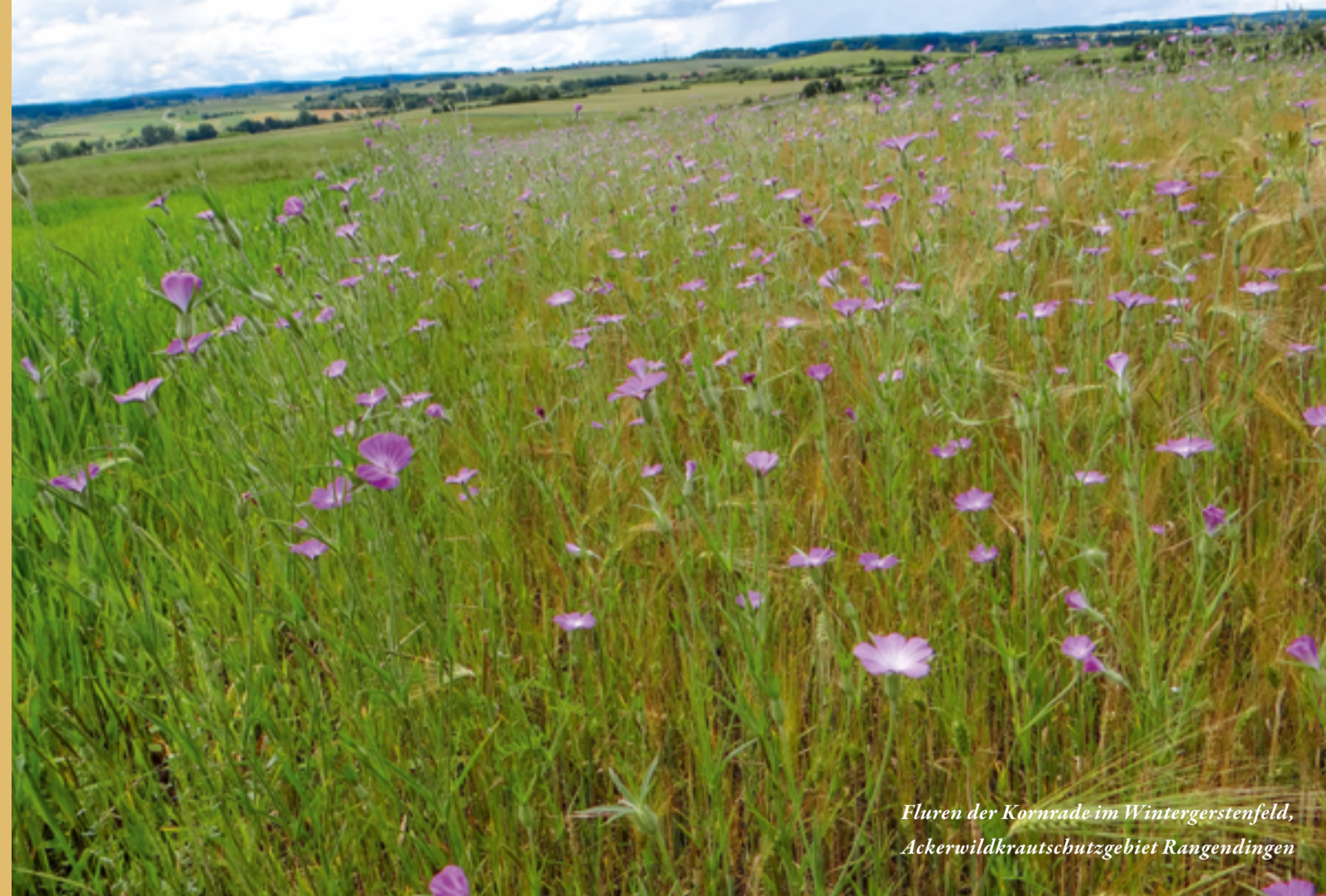
Fluren der Kornrade im Wintergerstenfeld, Ackerwildkrautschutzgebiet Rangendingen

Zu den Besonderheiten dieses Gebiets zählen z. B. die auffallend gestaltete Ranken-Platterbse und der Acker-Steinsame , zwei Arten, die aus dem Mittelmeerraum zu uns gelangten.