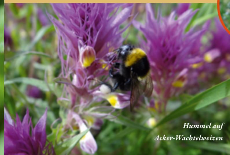
Hummel auf Acker-Wachtelweizen

Das zarte Wildkraut Kleiner Frauenspiegel , auch „Frauenspiegel“ und „Frauenviechen“ benannt, wächst nur 10 bis 15 cm hoch und ist äußerst selten geworden. Die Blüte misst gerade mal 7 mm im Durchmesser. Die Art gehört zu den Glockenblumengewächsen. Auf einem Acker der Gemeinde Eglingen auf der Schwäbischen Alb wurden letzte kleine Vorkommen dieser Art angetroffen. Seit vielen Jahren gehört der private Acker zum Schutzprojekt und wird von einem Bio-Landwirt bewirtschaftet. Der Kleine Frauenspiegel konnte sich auf der gesamten Fläche ausbreiten und wächst in manchen Jahren zu Hunderten unter dem Getreide, ohne dieses in der Entwicklung zu beeinträchtigen. Auch hier haben sich im Laufe der Jahre andere seltene Wildkräuter hinzugesellt, deren Samen noch im Boden überlebten, hierzu gehört der Acker-Zabutrrost .