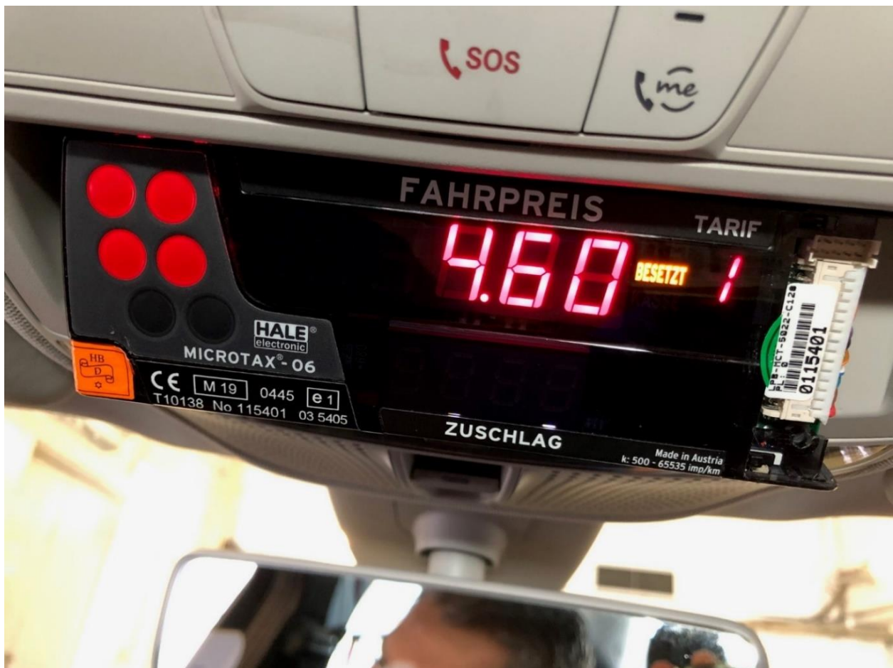
Bild: Prüfung von Taxameter zur korrekten Ermittlung des Fahrpreises

Nachdem während der Zeit der Corona-Pandemie die Eignungsprüfungen nicht im gewohnten Umfang durchgeführt werden konnten, wurde in 2023 mit einem Leistungsnachweis für die Prüfung von Taxameter hinsichtlich der korrekten Ermittlung des Fahrpreises begonnen. Hierzu wurden von den teilnehmenden Dienststellen Messungen und Kontrollen nach der Prüfanweisung „GM-P 12.17“ an einem „Referenz-Taxi“ durchgeführt. Die vorliegenden Zwischenergebnisse zeigen für die Mitglieder der 4-Länder-Kooperation sehr gute Ergebnisse. Der Abschlussbericht wird im Laufe des Jahres 2023 erwartet.