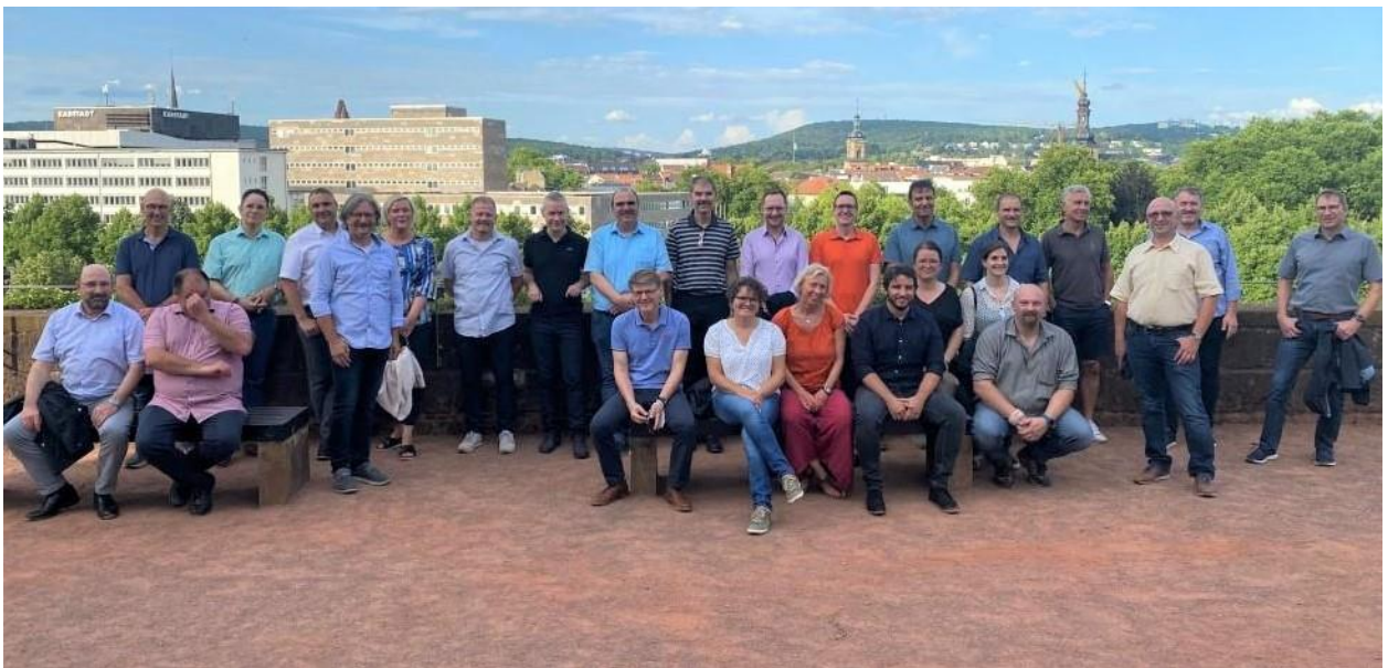
Bild: Kooperationstreffen in Saarbrücken 2022