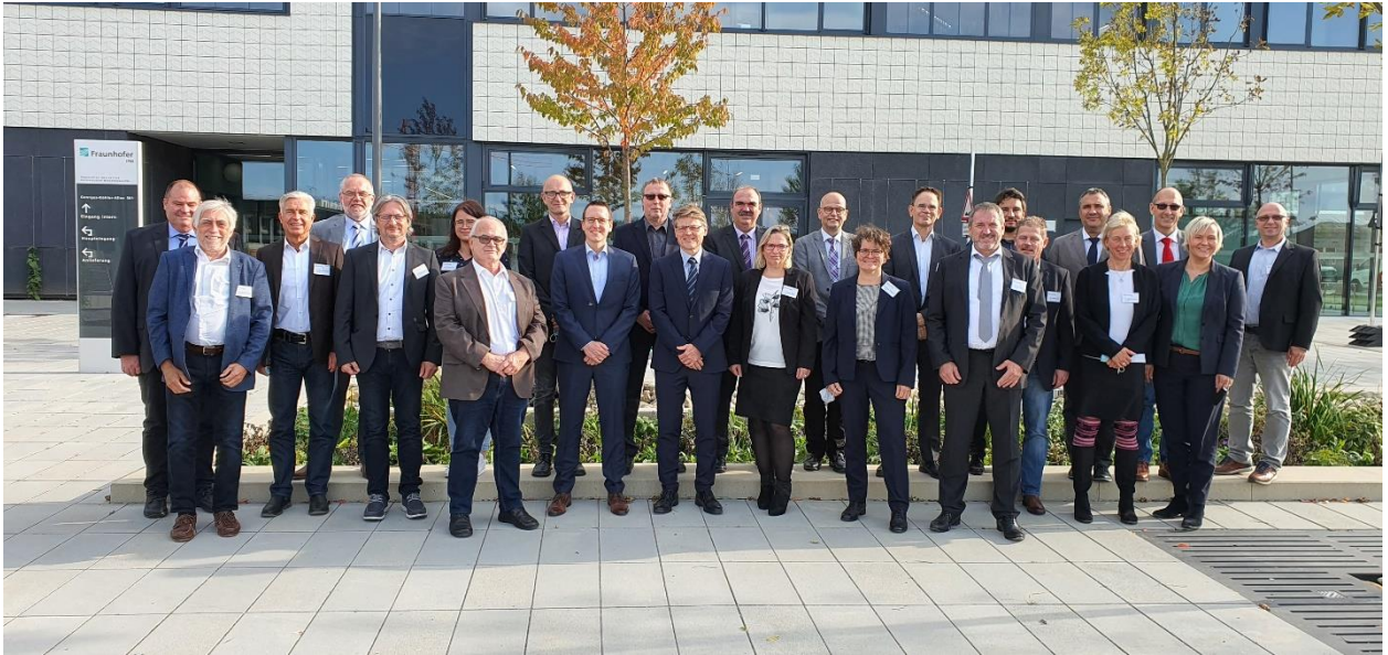
Bild: Kooperationstreffen in Freiburg 2021