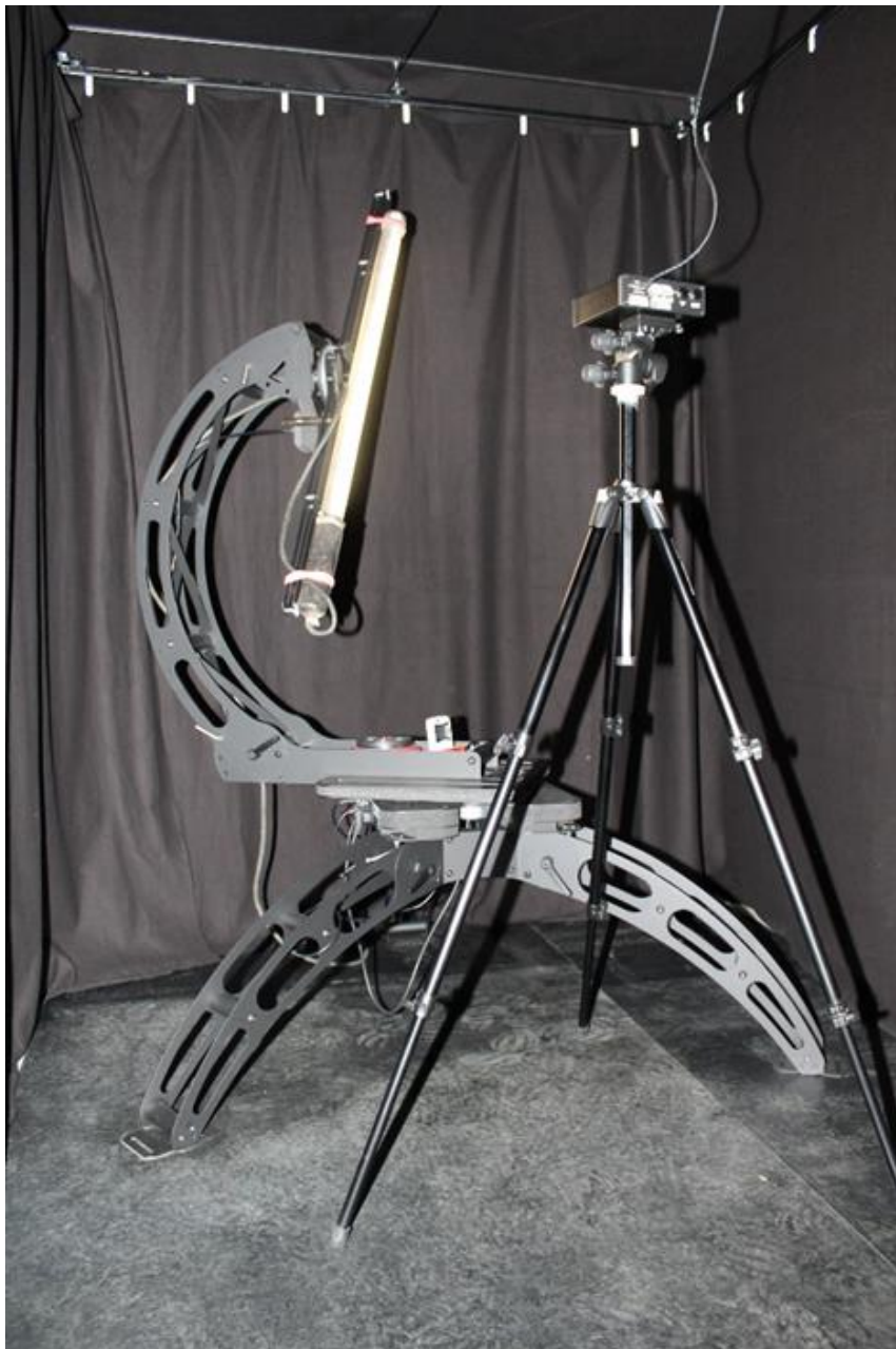
Bild: Photogoniometer zur Messung von Lichtquellen

Freie Prüfkapazitäten in den vorhandenen Laboren der Behörden können auch kurzfristig den jeweils anderen Bundesländern für die physische Prüfung von Produkten zur Verfügung gestellt werden. Zur Steigerung der Qualität der Messungen werden regelmäßig Eignungsprüfungen für die verschiedenen Messgrößen durchgeführt und bewertet.