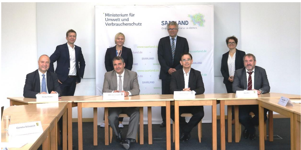
Bild: Kooperationsvereinbarung Saarland 2020

Aufgrund der positiven Erfahrungen und Auswirkungen der Kooperation wurde die Fortführung und Intensivierung der Zusammenarbeit seitens der Landesministerien aus Baden-Württemberg, Hessen, Rheinland-Pfalz und dem Saarland ausdrücklich befürwortet.