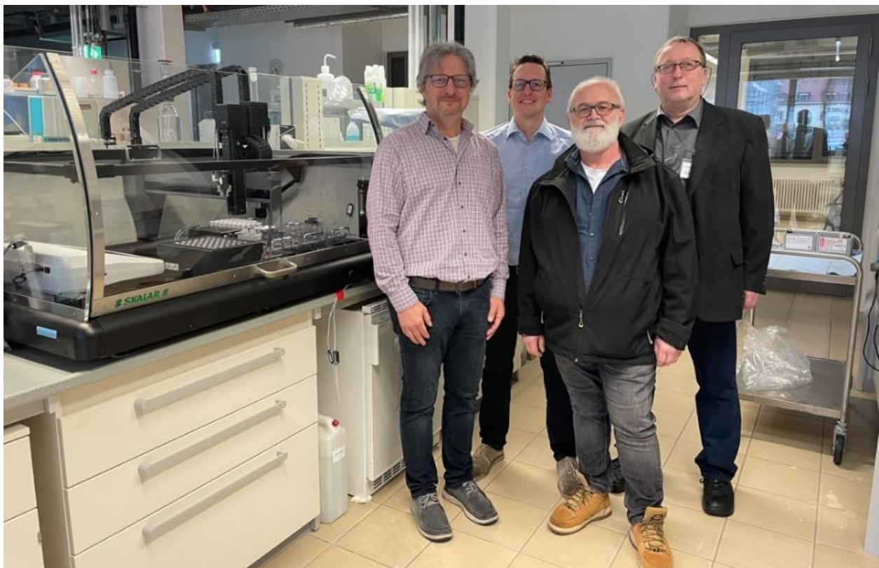
Bild: Treffen Konformitätsbewertungsstellen in Saarbrücken 2023