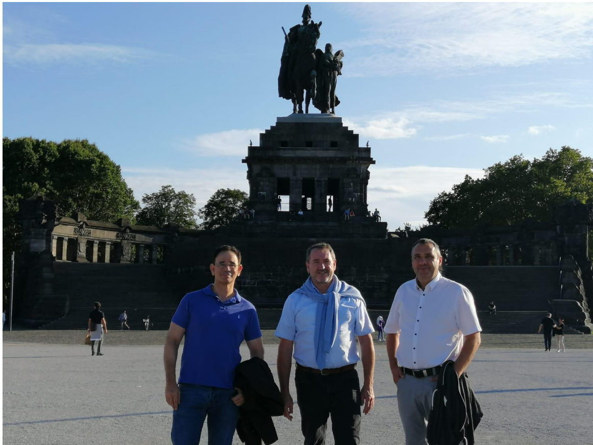
Bild: Direktorentreffen in Koblenz 2019