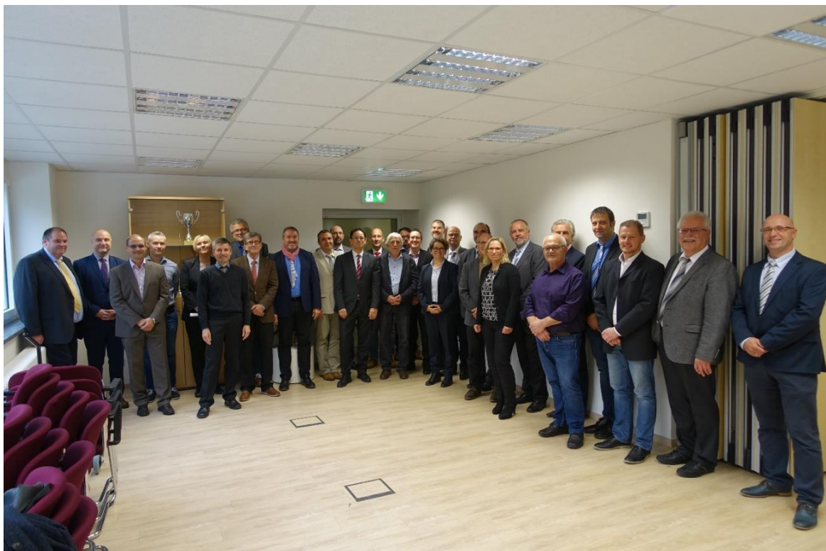
Bild: Kooperationstreffen in Marburg 2019