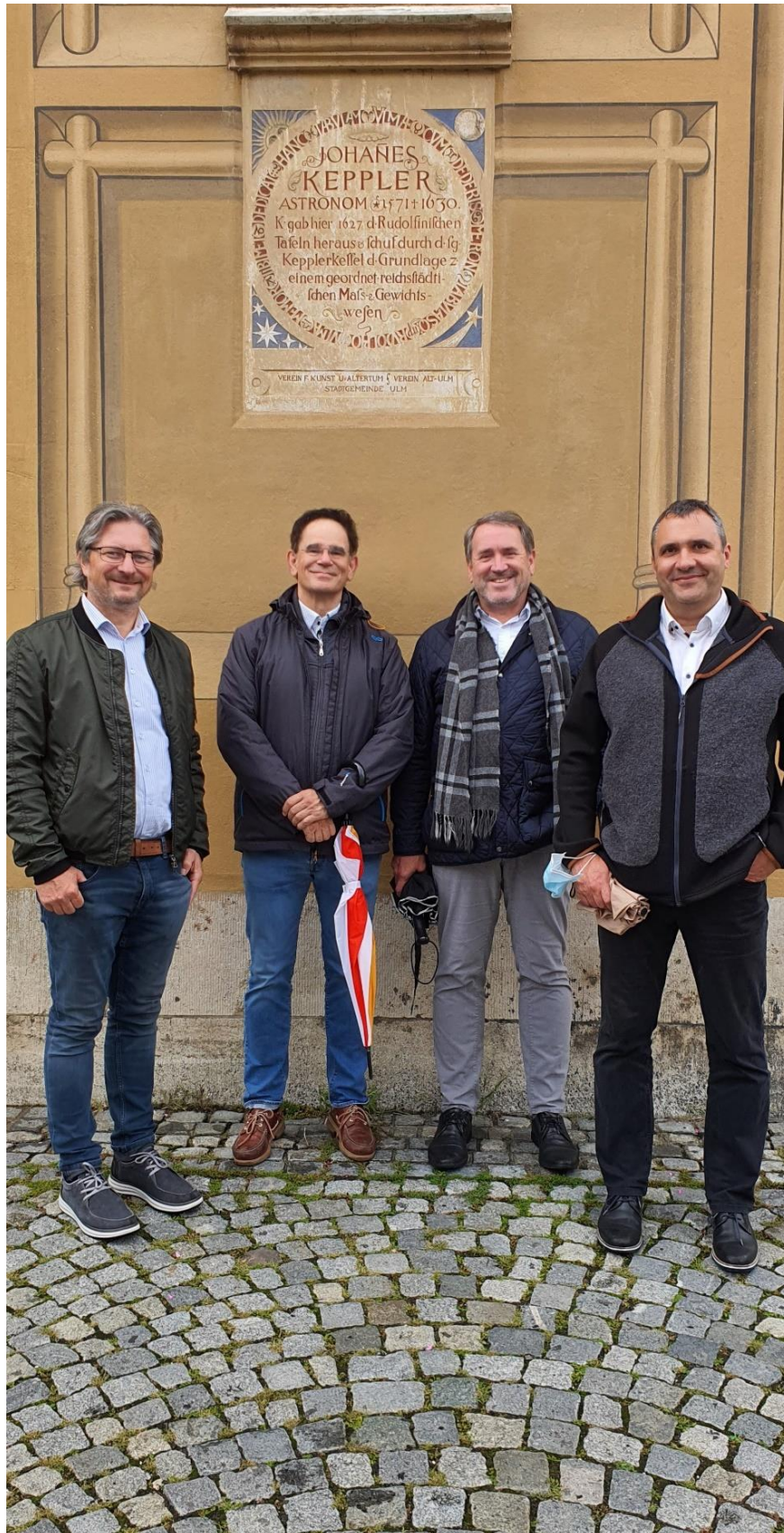
Bild: Direktorentreffen in Ulm 2021