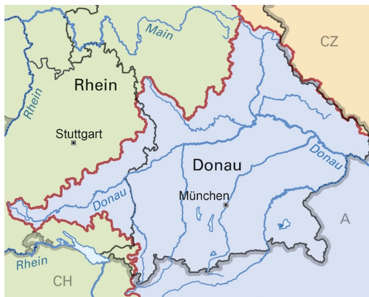
Abbildung 1: Übersicht über das deutsche Donaueinzugsgebiet

Das deutsche Donaueinzugsgebiet umfasst eine Fläche von 56 200 km 2 , sein Anteil am Gesamteinzugsgebiet der Donau beträgt ca. 7 %. Der baden-württembergische Flächenanteil hat eine Gesamtgröße von ca. 8.050 km 2 , der bayerische von ca. 48.200 km 2 . Die Donau beginnt am Zusammenfluss von Brigach und Breg, durchfließt dann auf einer Länge von knapp 200 km Baden-Württemberg bis sie bei Ulm die Landesgrenze überschreitet und anschließend rund 400 km auf dem Gebiet des Freistaates Bayern fließt. Ab der Einmündung der zum Main-Donau-Kanal ausgebauten Altmühl bei Kelheim ist die Donau Bundeswasserstraße und auf einer Länge von 213 km bis zur Staatsgrenze nach Österreich für große Binnenschiffe befahrbar.