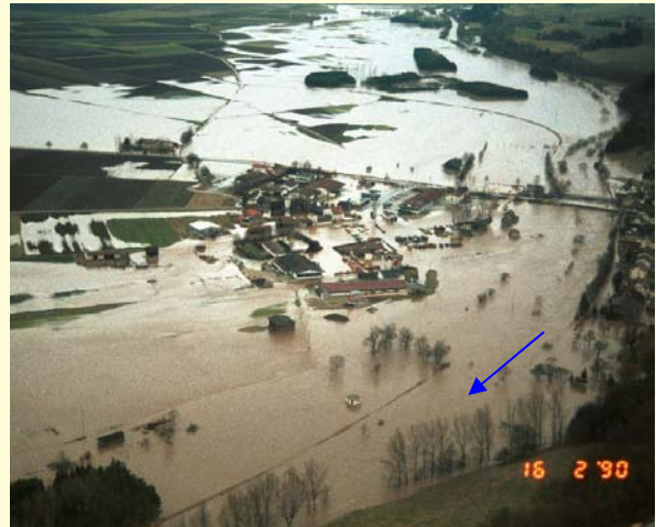
Hochwasser 1990 in Binzwangen