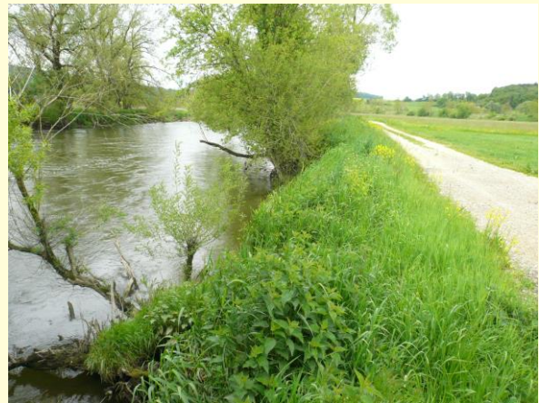
Zustand vor dem Umbau