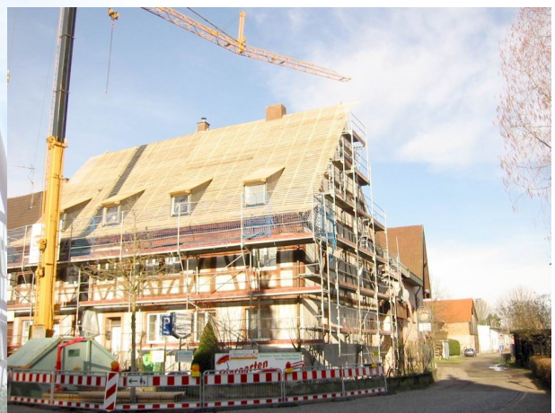
Gebäude während der Restaurierung