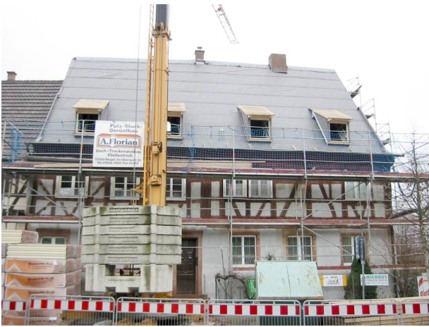
Gebäude während der Restaurierung