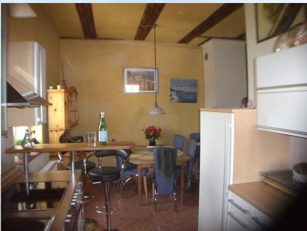
Lehmriegel in der Decke im vorderen Bereich