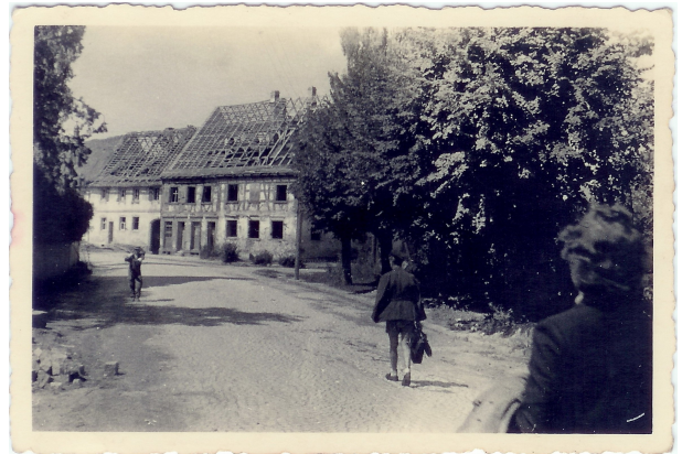
Zustand des Gebäudes nach dem Krieg