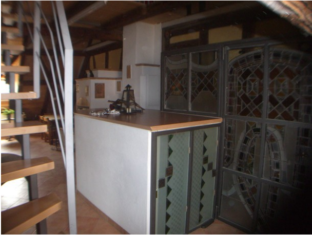
Dachgeschoss Wohnung nach Restaurierung, Eingang