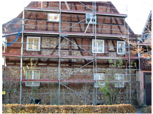
Gebäude ohne Putz