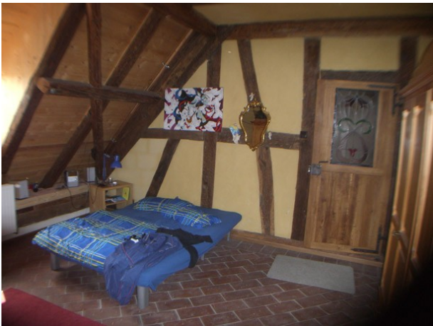
Vorderer Raum, sichtbare Lehmriegel und Windverbände