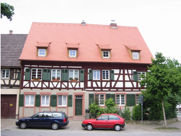
Aussenansicht nach Restaurierung