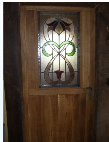
Eichtür mit Bleiglas