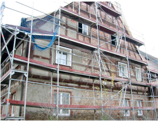
Gebäude ohne Putz