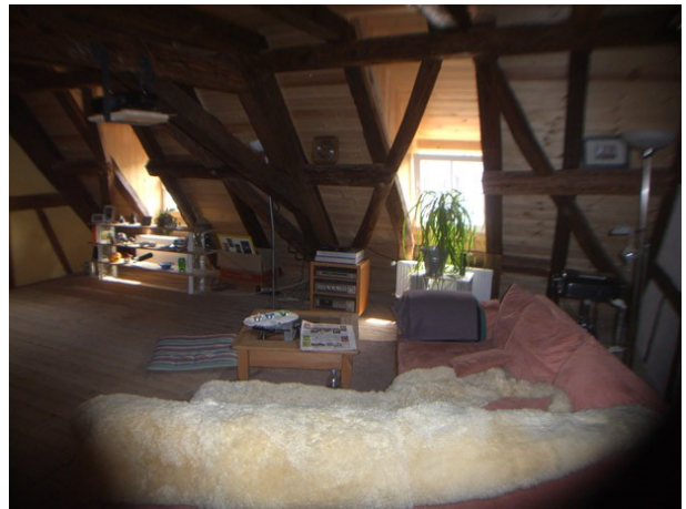
Hinterer Raum sichtbare Windverbände