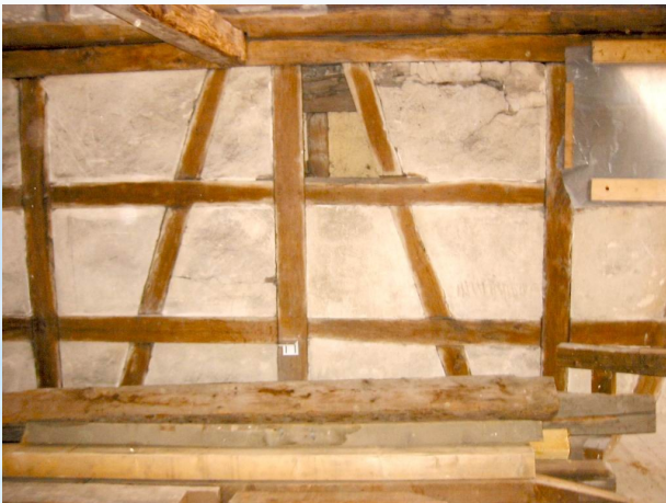
Lehmwand im Dachgeschoss vor der Restaurierung